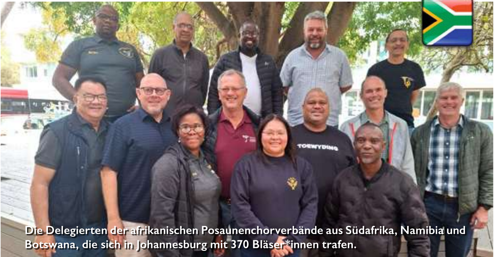
Die Delegierten der afrikanischen Posaunenchorverbände aus Südafrika, Namibia und Botswana, die sich in Johannesburg mit 370 Bläser*innen trafen.